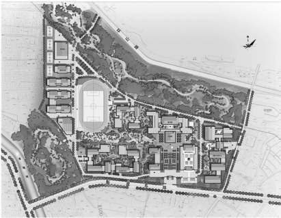
图 1 总平面图

生国学教育基地 1 000 人,硕士研究生 300 人,博士研究生 200 人,留学生 300 人.总体规划与单体由中国建筑西北设计院中国工程院院士、全国设计大师张锦秋院士主笔设计.以“源远流长,一脉相承”为理念的“新中式宋代风格”规划设计方案被广泛认可,如图 1 所示.